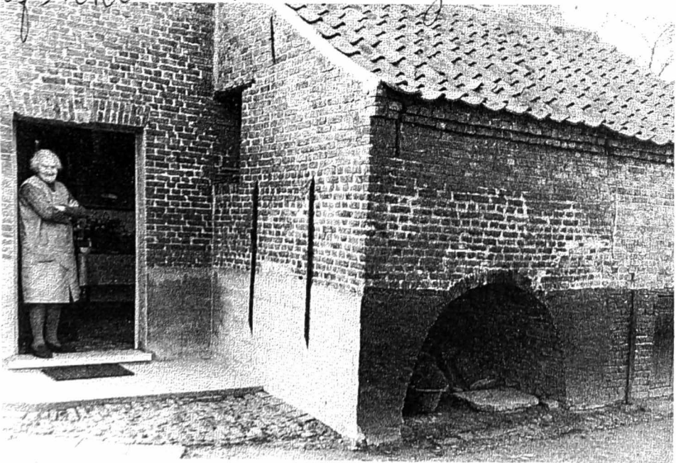
2. Een aangebouwde oven aan het «achterhuis» van de woning. Buitenzicht van de oven bij mevrouw Octaaf De Bruyne, Kruisstraat.