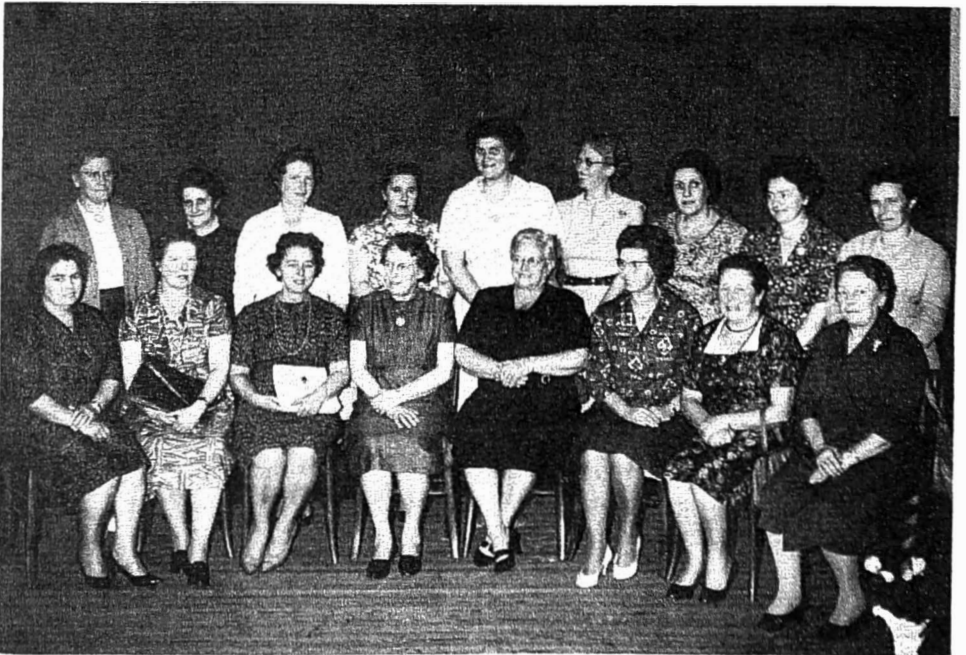
Het bestuur in 1959.

Speciaal willen wij hier vermelden dat de oorlogsjaren bijzonder druk waren. Er was dikwijls een speciale bedeling van kindervoeding zoals kindermeel voor de pap, verder koekjes, cacao, appelsienen, citroenen of iets dergelijks. Daarvoor kwamen de moeders soms een ganse namiddag aanschuiven; de aanbiedingen waren dan ook onbegrensd.