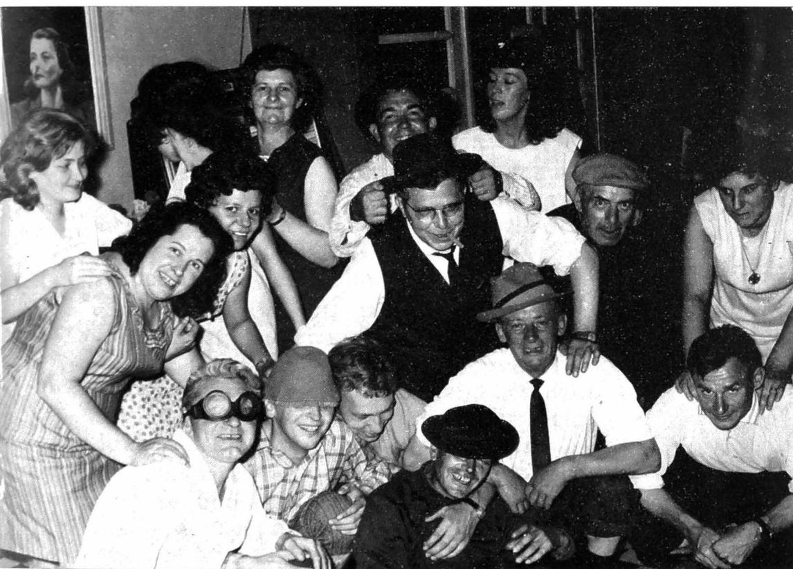
Uit het foto-album van St.-Jozef...