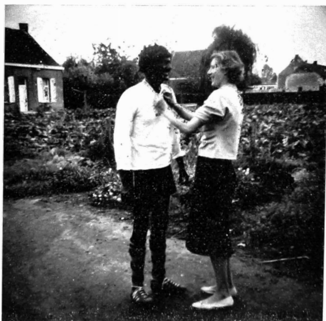
Mokuno uit Katanga...