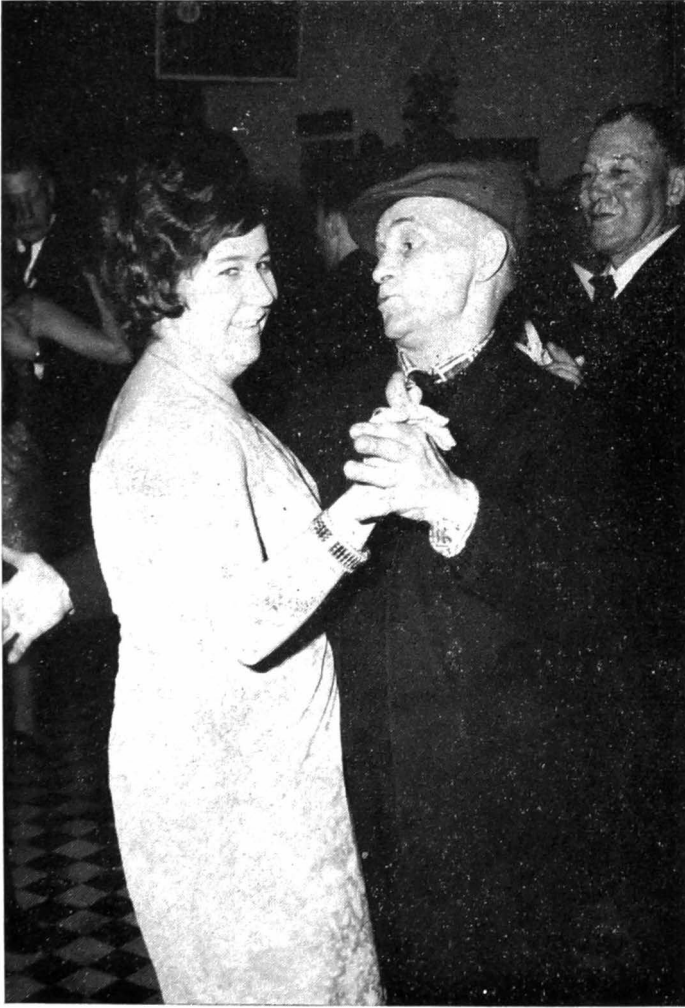
Uit het foto-album van St.-Jozef...