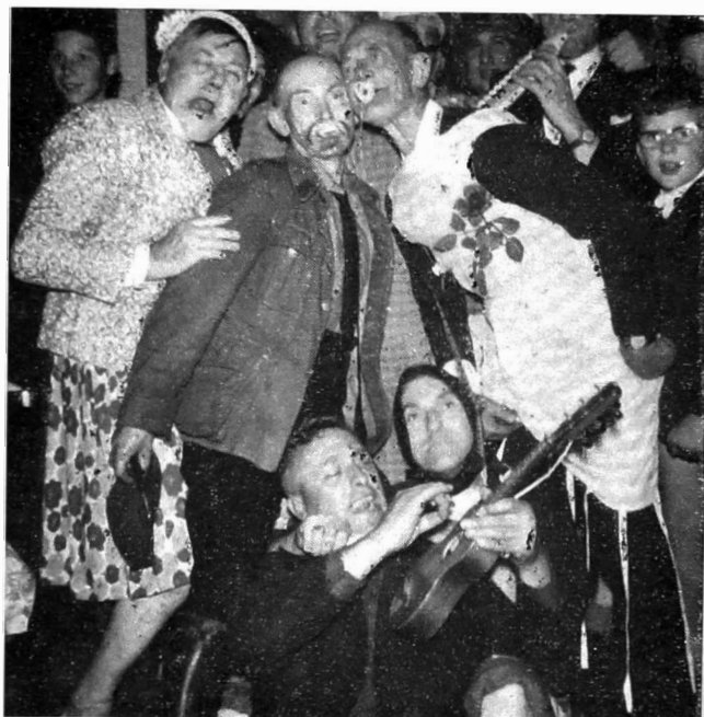
Gek doen in Konfrie-verband...